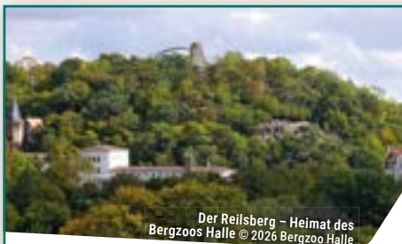
Der Reilsberg – Heimat des Bergzoo Halle