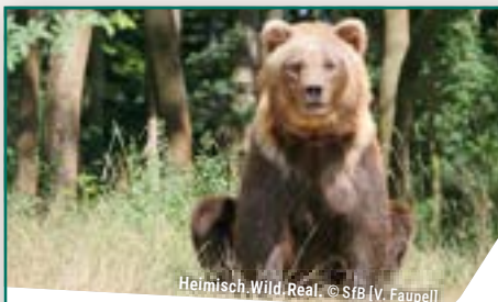
Heimisch Wild.Real.