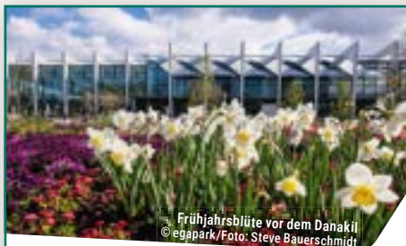
Frühjahrsblüte vor dem Danakil