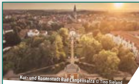
Kur- und Rosenstadt Bad Langensalza