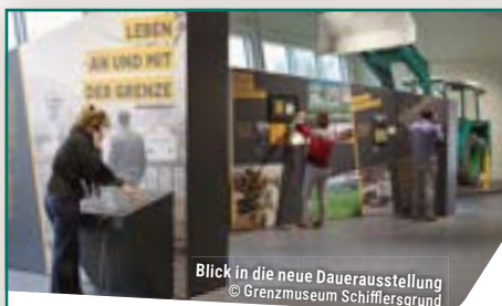
Blick in die neue Dauerausstellung