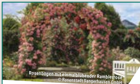
Rosenbogen mit einmalblühender Ramblerrose