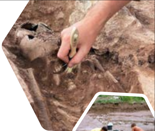
Freilegung eines mittelalterlichen Skelettes | Ausgrabungsteam auf der Wüstung Kirrode

Augarten und Gartenstadt stehen für den Stadtumbau 2.0 in Leinefelde: Wo einst mehr als 850 Garagen das Bild prägten, entstehen auf rund 15 Hektar neue Park-, Freizeit- und Ausstellungsflächen. Tausende Neupflanzungen, über eine Million Blumenzwiebeln, offene Entwässerungsgräben, Retentionsbodenfilter und die naturnahe Führung der Ohne zeigen nachhaltige Freiraumgestaltung . Ergänzt wird das Areal durch Themengärten, Wechselflor, Spiel- und Sportbereiche, Gastronomie sowie die Wüstung Kirrode als spannender Blick in die Geschichte .