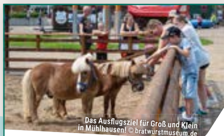
Das Ausflugsziel für Groß und Klein in Mühlhausen!