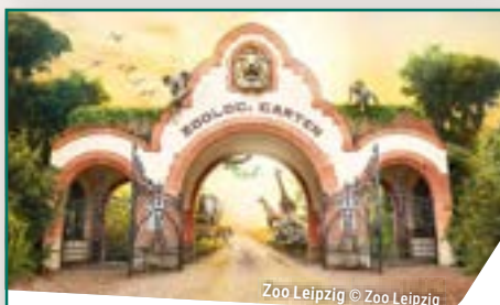
Zoo Leipzig