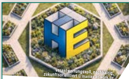
Verantwortungsvoll, nachhaltig, zukunftsorientiert