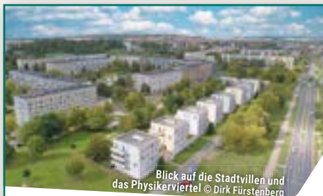
Blick auf die Stadtviellen und das Physikerviertel