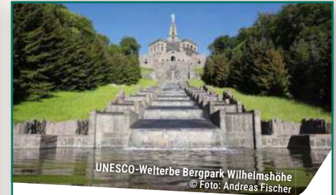
UNESCO-Welterbe Bergpark Wilhelmshöhe