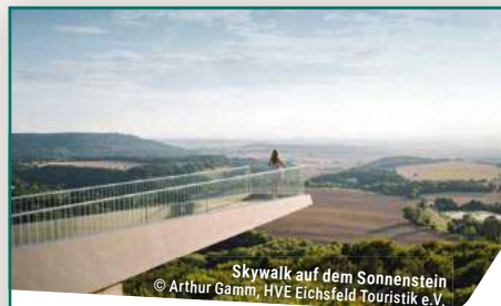
Skywalk auf dem Sonnenstein