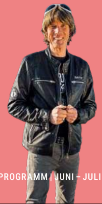
Mickie Krause