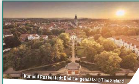
Kur und Rosenstadt Bad Langensalza