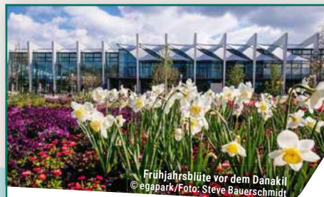
Frühjahrsblüte vor dem Danakil