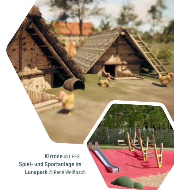
Kirrode Spiel- und Sportanlage im Lunapark

Im Augarten der Landesgartenschau wird ein fast vergessenes Kapitel der Eichsfelder Geschichte neu erzählt: Die Wüstung Kirrode, deren Spuren im Zuge der Bauarbeiten in der Ohne-Aue entdeckt und gesichert wurden, macht das Leben eines mittelalterlichen Dorfes wieder sichtbar. Ein archäologischer Pfad zeichnet die früheren Siedlungsstrukturen nach, symbolische Gebäudeformen lassen erahnen, wo einst Häuser gestanden haben könnten. Über eine Audioführung begleitet der fiktive Müllersohn Simon die Gäste durch sein Dorf und berichtet vom Alltag der Menschen. Ergänzt wird das Angebot durch eine humorvolle Maulwürfin, die besonders jüngere Besucher auf archäologische Spurensuche mitnimmt. Eine virtuelle 360-Grad-Tour rundet das Angebot ab. So verbindet Kirrode regionale Geschichte, digitale Vermittlung und Naturerlebnis zu einem besonderen Ort für alle Generationen.