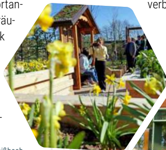
Besucher erkunden die Themengärten © René Weißbach Insektenhotels im Lunapark © René Weißbach

gen in einem ehemaligen DDR-Wohnblock und die Wüstung Kirrode, die als archäologischer Erlebnisort mittelalterliche Geschichte sichtbar macht. So wird die Landesgartenschau zu mehr als einem Ereignis für 172 Tage: Sie steht für nachhaltigen Stadtumbau, neue Begegnungsorte und eine Stadt, die Herkunft, Landschaft und Zukunft miteinander verbindet.