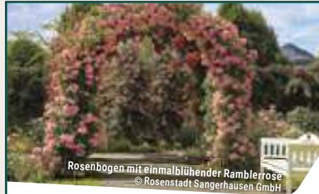
Rosenbogen mit einmalblühender Ramblerrose