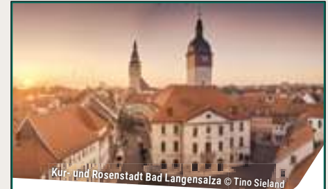
Kur- und Rosenstadt Bad Langensalza