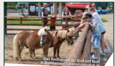
Das Ausflugsziel für Groß und Klein in Mühlhausen!