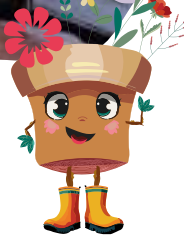
Blumenblock © Eckhard Jüngerl (2)

immer wieder neu in Szene und zeigt florale Gestaltung in einem außergewöhnlichen Umfeld. Sehenswert ist außerdem die Ausstellung „iga *61. Geschmack und Impulse“ des egaparks Erfurt. Das Deutsche Gartenbaumuseum präsentiert die Wanderausstellung „Geschmack der Regionen“, in der alte Pflanzensorten vorgestellt und durch echte Anbaupflanzen in 28 Hochbeeten erlebbar gemacht werden. Weitere Einblicke bieten die Präsentation der Grünen Berufe durch die Grünen Verbände, die Zwergenwerkstatt aus Gräfontonna sowie eine Ausstellung von Holzbildhauermeister Christoph Haupt mit Fotografie und Malerei. Ein besonderer Anziehungspunkt ist die Stadtbauausstellung mit originaler DDR-Nostalgiewohnung, die Alltagsgeschichte anschaulich und emotional erlebbar macht. So wird der Blumenblock zu einem der vielseitigsten und überraschendsten Orte der Landesgartenschau.