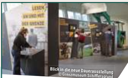
Blick in die neue Dauerausstellung