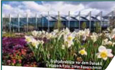
Frühjahrsblüte vor dem Danakil