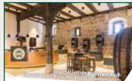
Besucherzentrum Whiskywelt Burg Scharfenstein