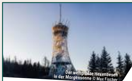
Der weltgrößte Hexenbesen in der Morgensonne